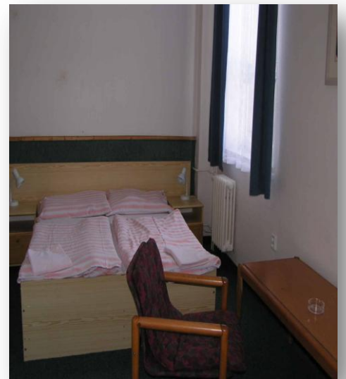
Doppelzimmer im Hotel